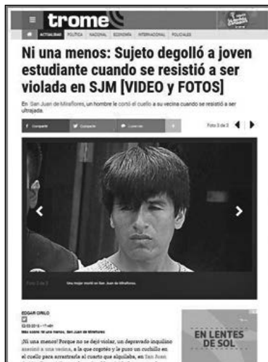
Figura 4 Narrativa canónica del diario Trome

«Ni una menos: Sujeto degolló a joven estudiante cuando se resistió a ser violada en SJM [VIDEO Y FOTOS]», por web del diario Trome , 2018 ( https://trome.pe/actualidad/crimen-estudiante-degollada-violacion-san-juan-miraflores-video-fotos-77191 ).