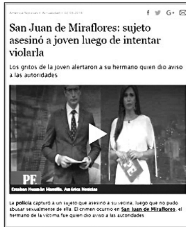
Figura 3 Narrativa canónica de América Noticias

«San Juan de Miraflores: sujeto asesinó a joven luego de intentar violarla», por web América Noticias, 2018 ( https://www.americatv.com.pe/noticias/actualidad/san-juan-miraflores-sujeto-asesino-joven-luego-intentar-violarla-n312558 )