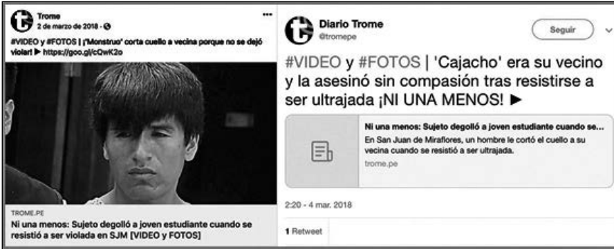
Figura 5 Publicaciones en Facebook y Twitter del diario Trome

Capturas de pantalla sobre el caso de Paola en Facebook y Twitter.